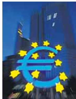
BCE recomenda austeridade

O BCE afirma que as principais economias do Norte - Alemanha, França, Grã-Bretanha, EUA - chegaram a um ponto em que precisam de uma rápida redução e austeridade fiscal,